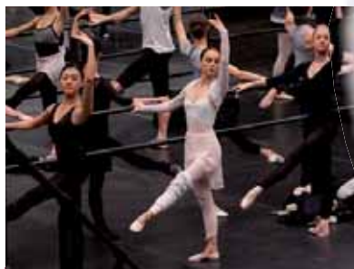
Thriller de Darren Aronofsky Avec Natalie Portman, Vincent Cassel Durée : 1h43

Durant les dix mois qui ont précédé le tournage, elle s'est entraînée tous les jours pendant cinq heures sous la tutelle de plusieurs professeurs et répétitrices professionnelles.