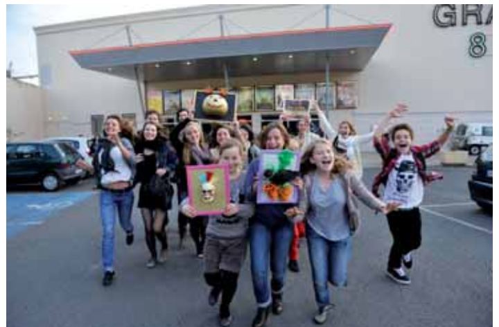
Ci-dessus les heureux gagnants de la 6trouille d'Or, remportée cette année par le groupe de Pessac.

3 La Ville de Libourne aime le cinéma et participe activement au développement d'actions et d'événements en direction du 7 ème Art.